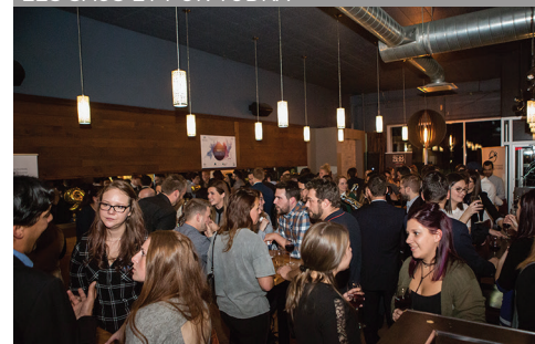
BRASSE TES CONTACTS