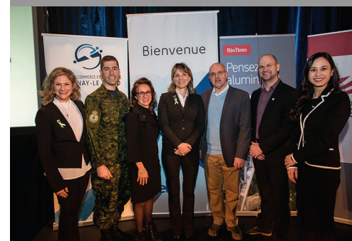
FAITES AFFAIRE AVEC CONSTRUCTION DÉFENSE CANADA - BFC BAGOTVILLE