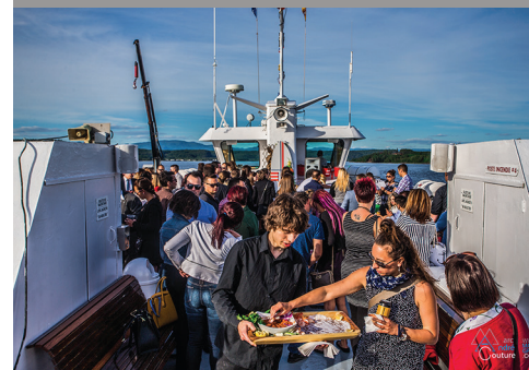
CAP SUR LES AFFAIRES 2017 CROISIÈRE RÉSEAUTAGE