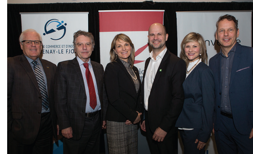
MÉTAUX BLACKROCK EN ROUTE VERS LA CONSTRUCTION EN 2019