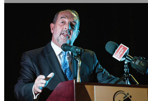
LANCEMENT DES ACTIVITÉS 2017-2018