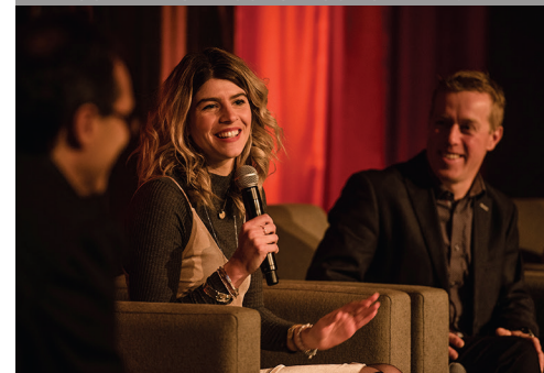
BRUNCH DE NOËL NOS HISTOIRES D'ICI!