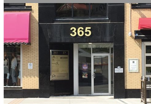
DIRECTEMENT SUR LA RUE RACINE