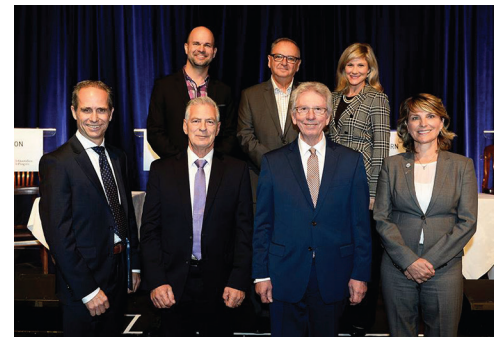
DÉBAT DES CANDIDATS À LA MAIRIE DE SAGUENAY