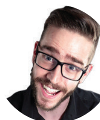
MARC-ANDRÉ COUTURE MAC Photographie