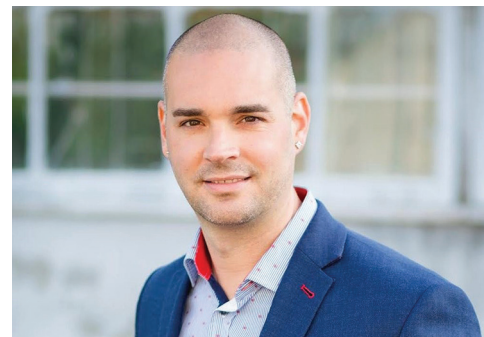
SOIRÉE DE MATCH INÉDITE LES SAGS ET PUR VODKA

La Jeune Chambre organise des activités dynamiques ouvertes à tous les membres de la Chambre et de la Jeune Chambre pour assurer un maillage intéressant entre les différentes générations d'entrepreneurs. À l'inverse, tous les membres de la Jeune Chambre ont accès aux événements de la Chambre.