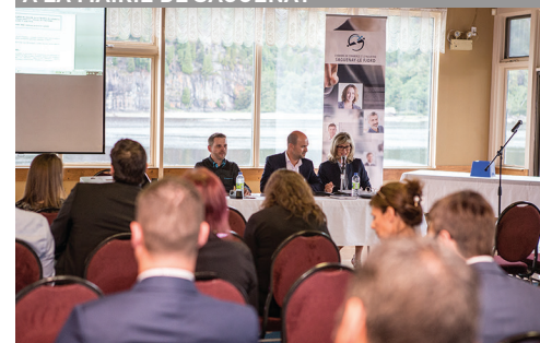
ASSEMBLÉE GÉNÉRALE ANNUELLE 2017