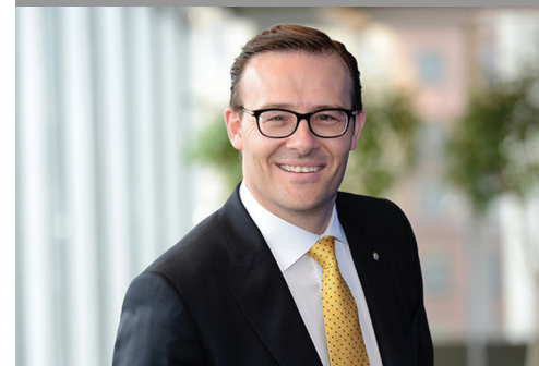
L'ENTREPRENEURSHIP : UNE VOIE GRANDE OUVERTE SUR NOTRE PROSPÉRITÉ COLLECTIVE!