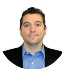
ALEXANDRE HARVEY GESTION IMMOBILIÈRE HARVEY'S Secteur : Parcs industriels