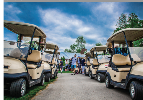
TOURNOI DE GOLF CHAMBRE ET JEUNE CHAMBRE 2017